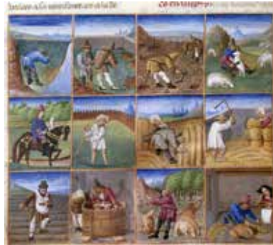
Calendrier issu du Rustican de Pietro de Crescenzi. Miniature du maître du Boccace de Genève issue du manuscrit du musée Condé, vers 1470-1475.

6 En mars, ils taillent les vignes à la serpe . 7 1