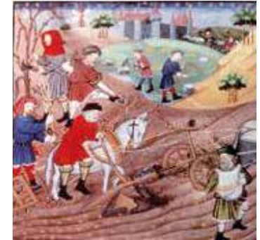
Paysans labourant un champ, enluminure du XV e siècle.

8 Les paysans moissonnent à la faucille en juillet . 9 7